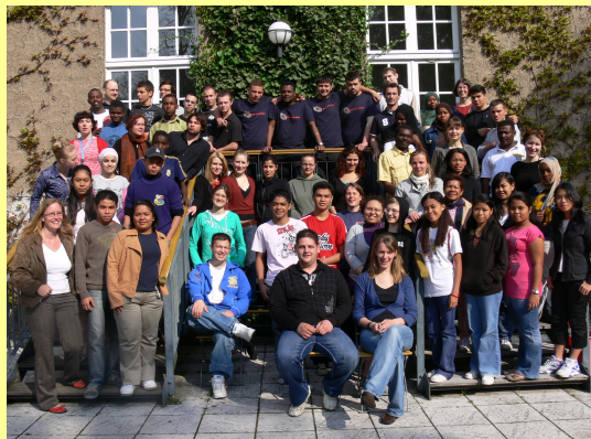
Die TeilnehmerInnen der 1. Internationalen Springschool in Wertpfuhl 2008