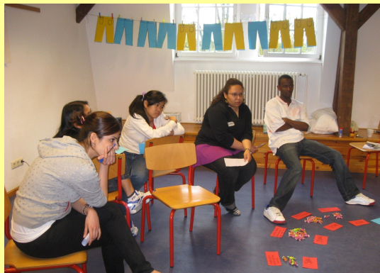
Im Textilworkshop schätzen die TeilnehmerInnen z.B. wo Kosten und Gewinne bei der Herstellung einer Jeans entstehen.