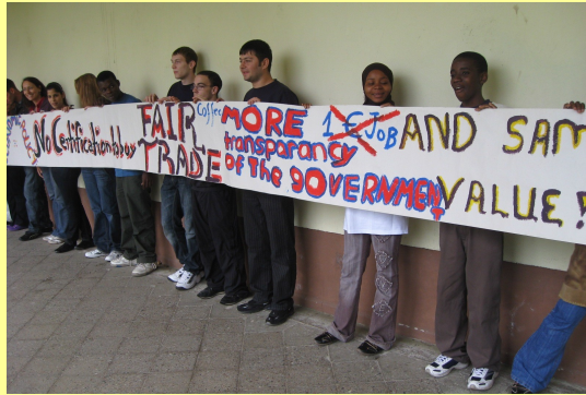
Die Auszubildenden gestalteten ein Transparent mit ihren Forderungen zum 1. Mai